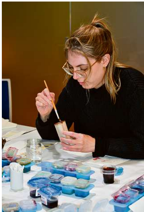
Aquarellmalerei mit Naturfarben – ein nachhaltiges Erlebnis.