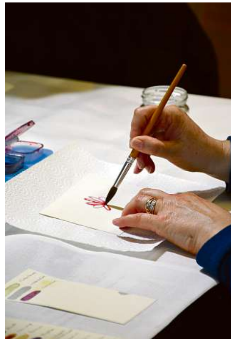
Der eigenen Kreativität waren dabei keine Grenzen gesetzt.