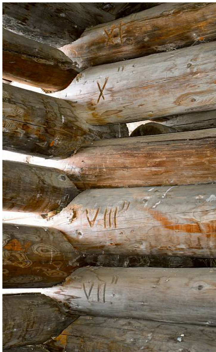
Die eingeritzten Zahlen erleichtern den Wiederaufbau des Stalls an einem anderen Ort.

Und was die Angebote der ArosaAkademie auch gezeigt haben: Wer mal keine Lust zum Skifahren oder Winterwandern hat – einfach mal in den Veranstaltungskalender der «Aroser Zeitung» schauen.